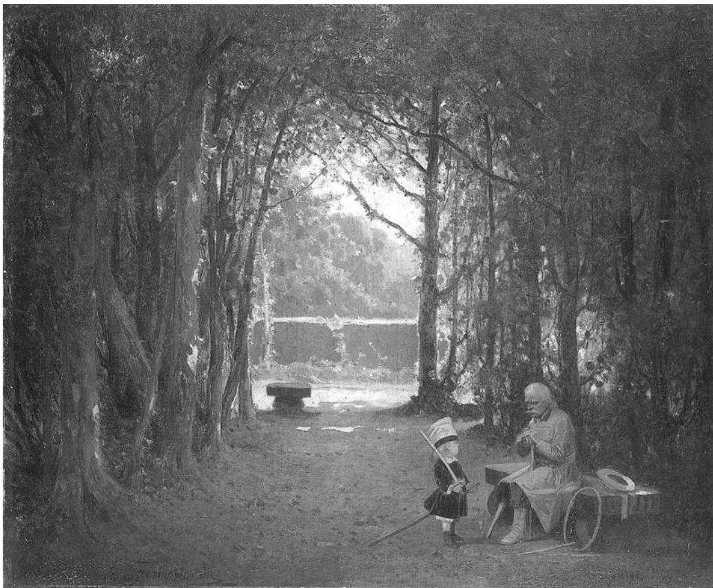
Józef Szermentowski, Stary żołnierz i dziecko w parku , 1869, olej na płótnie, Muzeum Narodowe Poznań

Napisz opowiadanie z dialogiem i opisem. Bohaterami swego tekstu uczynić postacie z obrazu Józefa Szermentowskiego pt. Stary żołnierz i dziecko w parku .